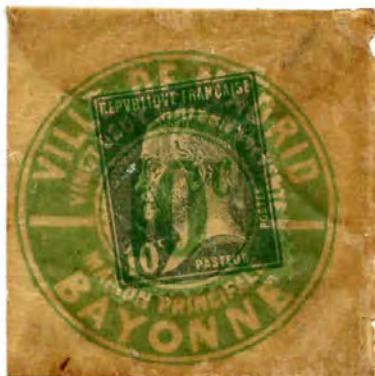
Ce timbre monnaie provient de la collection Broustine