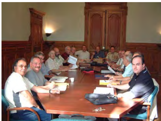
Vos délégués au travail lors de la réunion du samedi 9 juin à Sète