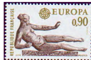
« L'air »