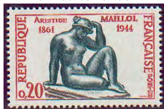
« La méditerranée »