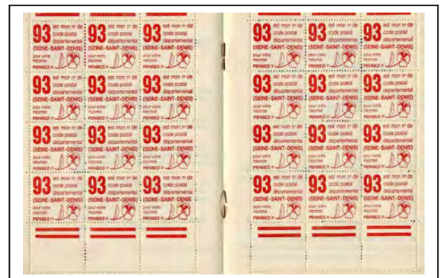
Carnet 24 vignettes « 93 », avec coin daté partiel.

Sur la marge inférieure, côté droit, coin daté du 11/8/1966 et du 1/9/1967. Le massicotage fait parfois disparaître ces informations.