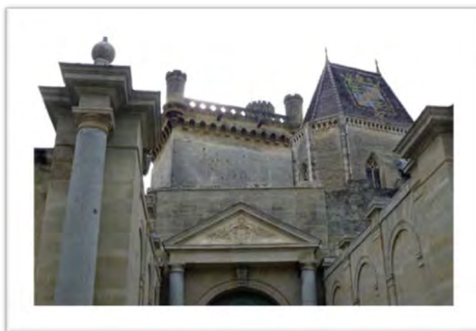
Le château, vu de la salle d'exposition