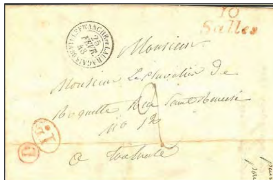
Figure 2 Lettre de Salles pour Toulouse transitant par le bureau de Direction de Villefranche de Lauragais (Hte Garonne) au lieu d'être dirigée vers le bureau de Castelnaudary.

Attention de ne pas confondre le cas des deux documents précédents dont le trajet pris est fonction de la destination du courrier avec les deux documents qui suivent :