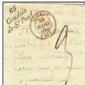
Figure 1 Lettre de Caudiès de St Paul (Pyr.Or.) pour Carcassonne transitant par le bureau de Direction de Quillan (Aude)