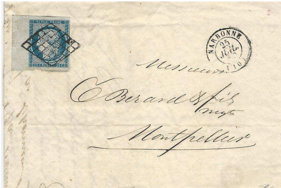
Lettre du 25 juillet 1850 de Narbonne pour Montpellier affranchie avec un 25 c. "Cérès" bleu bord de feuille annulé par le "losange grillé" du bureau de direction. Tarif du 1er juillet 1850 à 25 c pour une lettre jusqu'à 7,5 g de bureau à bureau.