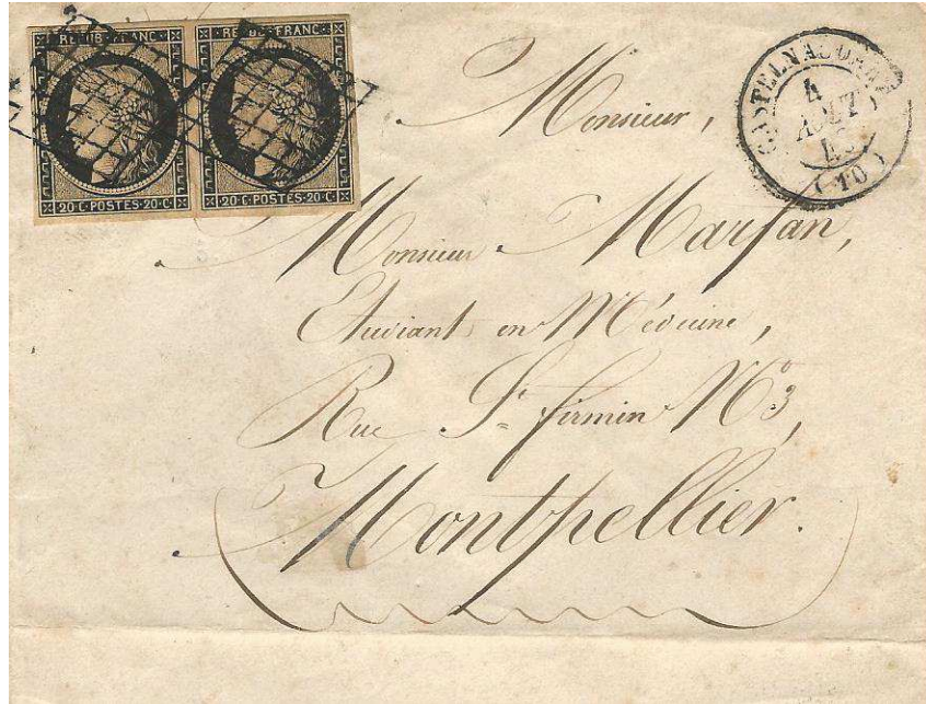
Lettre du 4 août de Castelnau-d'Aud pour Montpellier affranchie avec une paire de 20 c "Cérès" noir imprimé sur papier chamois, annulée par le "losange grillé". Tarif du 1er janvier 1849 à 40 c pour une lettre de 7,5 g à 15 g de bureau à bureau.

Apposition du "losange grillé" sur le timbre-poste pour annulation.