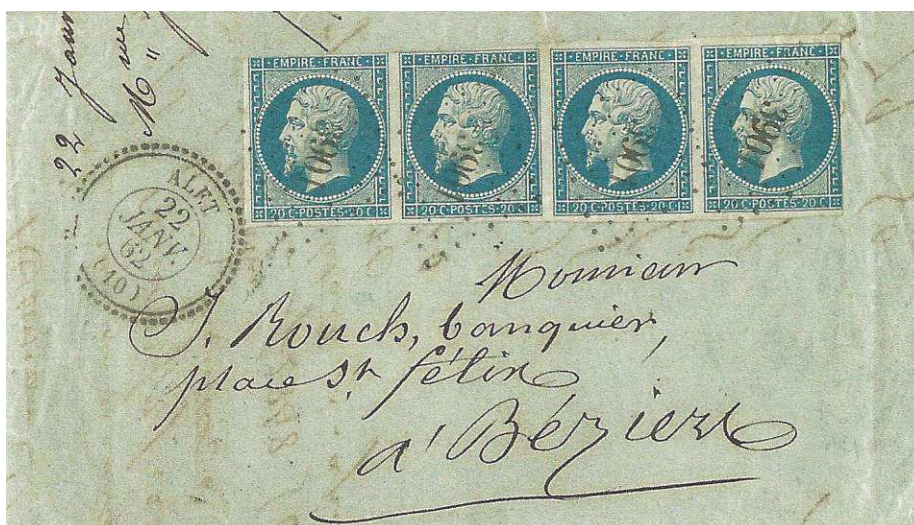
Lettre d'Alet pour Béziers du 22 janvier 1862 affranchie avec une bande de 4 exemplaires du 20 c. Empire non dentelé, avec le losange "petits chiffres" n° 3901 du bureau de Distribution. Tarif à 80 c. du 1er juillet 1854 pour une lettre de 15 à 100 grammes de bureau à bureau.

Losange "petits chiffres" d'un bureau créés après le 1er janvier 1852. (le bureau de Distribution d'Alet a été créé en mai 1855)