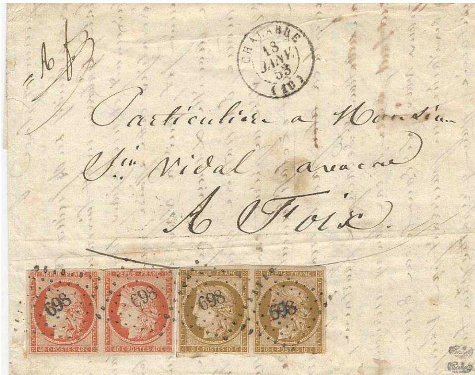
Lettre de Chalabre pour Foix du 13 janvier 1853 affranchie avec une paire du 40 c. orange et une paire du 10 c. bistre Cérés frappées du losange "petits chiffres" n° 698 du bureau de Direction. Tarif à 1 f. du 1er juillet 1850 pour une lettre de 15 à 100 grammes de bureau à bureau.